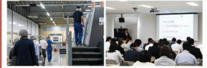
工場案内(左)とセミナー(右)の様子です。

9月26日(木)に『MARU-SIN SOLUTION 2019』(通称:オープンハウス)を開催しました。6つのセミナーと工場見学に、延べ255名の方々のご来社頂きました。誠にありがとうございました。セミナーでは、今後の表示切替とHACCP認証取得に向けた食品表示、食品衛生セミナーが最も多くの来場者となりました。これからも皆様のお困り事を解決できるようなご提案を行って参りたいと考えております。