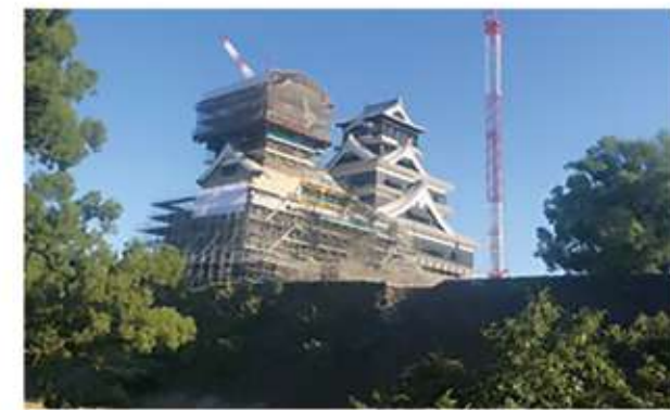
熊本城の近くまで来ました! まだまだ復興途中ですが、近くで見るとすごい迫力です!