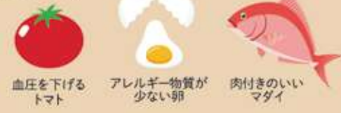
血圧を下げるトマト アレルギー物質が少ない卵 肉付きのいいマグイ

ゲノム編集は、狙った遺伝子を切断して機能を変えたり喪失させることで、効率よく品種改良を行う技術。例えば、特定の栄養の多いトマトや収穫量の多いイネ、アレルギー物質の少ない卵、肉付きのいいマグイなどの開発が可能になる。外部から加えた遺伝子が残る場合は、従来の遺伝子組み換え食品と同じ扱いで安全性審査が必要になる。