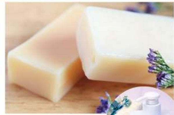
まるは油脂化学株式会社 福岡県久留米市高野町2丁目8-53